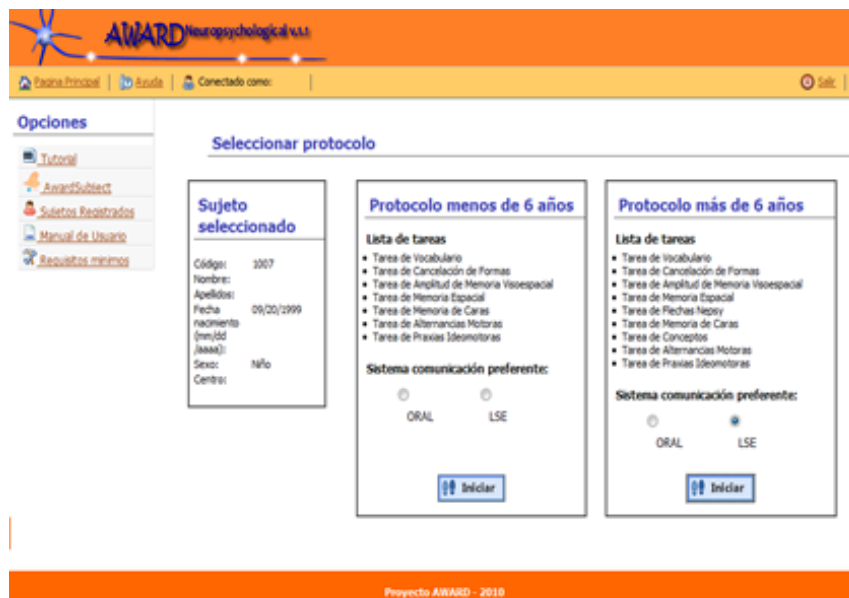
Figura 1. Pantalla de inicio de la aplicación AWARD Neuropsychological v.1.1.

ción informatizada (v.g. Etchepareborda, Paiva-Barón y Abad, 2009), soluciona gran parte de las limitaciones y problemas con los que algunos profesionales se encuentran a la hora de tener que evaluar a niños que utilizan como sistema de comunicación preferente la LSE. Gracias a la utilización de tecnología web adaptativa, la herramienta puede modificar sus elementos de interacción, de manera que una vez que el evaluador selecciona la edad y el sistema de comunicación utilizado preferentemente por el niño (Oral vs. LSE), se adaptan las secuencias de ejecución de forma que tanto las instrucciones como las pantallas con los ejemplos de cada tarea aparecen con texto (para la modalidad Oral) o en vídeo (para la modalidad LSE). En las Figuras 1 y 2 se muestran capturas de pantalla de la aplicación en la que se puede observar como en función de los valores que especifique el examinador, los formatos de presentación se adaptan al sistema de comunicación del niño.