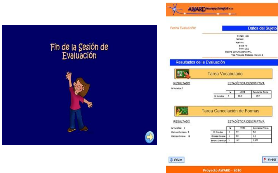
Figura 3. Pantalla de fin sesión e informe de resultados.

Una vez finalizada la sesión de evaluación, la aplicación proporciona un informe de resultados que es posible imprimir y/o guardar en formato electrónico -en fichero pdf- (ver Figura 3). En este informe, además de aparecer resumidas las puntuaciones obtenidas por el niño en cada una de las tareas, también se proporcionan los datos del grupo normativo correspondiente a su perfil, es decir, la información con respecto a la puntuación media y desviación típica obtenida por el grupo de niños de la misma edad y sexo que utilizan preferentemente el mismo sistema de comunicación que el evaluado (LO vs. LSE).