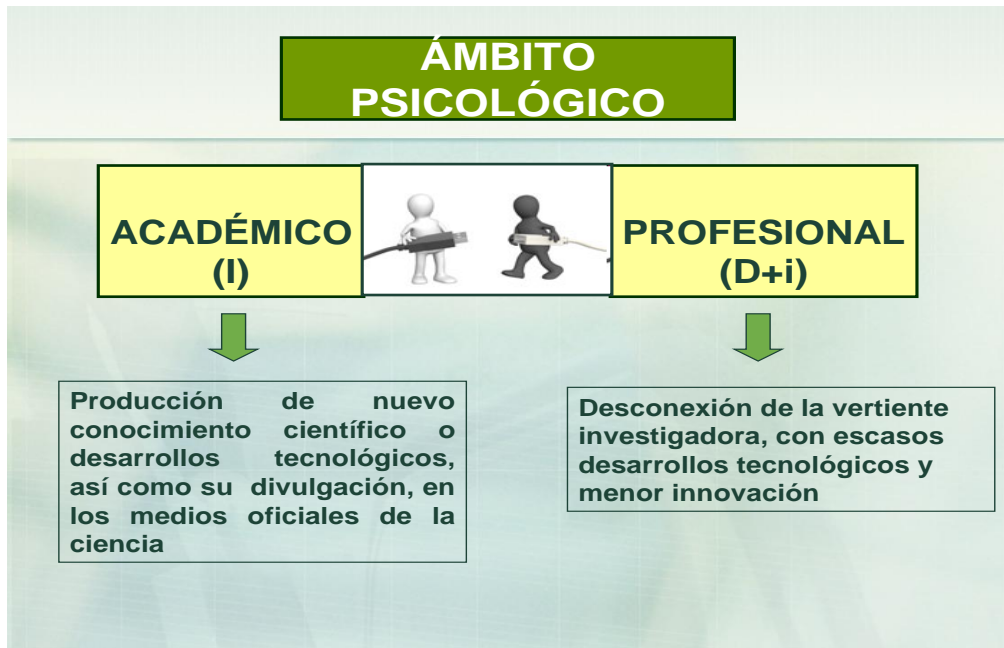
Figura 2. Desconexión entre los elementos de la cadena de valor I+D+i

trabajo. En este caso la innovación es un componente implícito requerido en la práctica profesional para dar respuesta a las nuevas demandas. Sin embargo, tampoco ocurre siempre así. Este hecho es lo que se ha denominado “ruptura o falta de integración de la cadena de valor I+D+i” (De la Fuente y Vera, 2010), representado gráficamente, en la Figura 2.